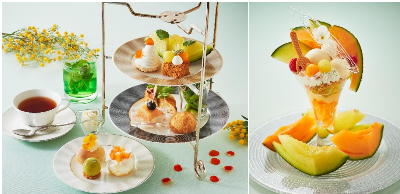
左：「メロンのアフタヌーンティーセット」、右：「メロンパフェ」イメージ

大阪 心斎橋のホテル日航大阪（大阪市中央区西心斎橋 1-3-3、代表取締役社長・総支配人：呉服 弘晶）は、2024年5月1日（水）から6月30日（日）までの期間、「ロビーラウンジ」（2階）にて「メロンのアフタヌーンティーセット」、ティーラウンジ「ファウンテン」（1階）にて「メロンパフェ」を提供いたします。